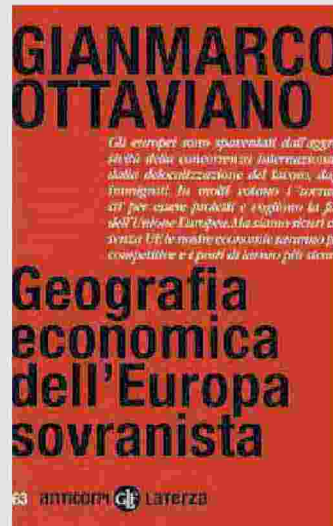
Gianmarco Ottaviano Geografia economica dell'Europa sovranista LATERZA