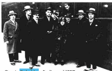
Grazia Deledda a Berlino nel 1927, in viaggio verso Stoccolma per ritirare il Nobel.

A 18 anni annota l'indirizzo di una rivista di Roma che gira per casa, l' Ultima Moda , e spedisce un racconto, Sangue sardo , storia di una ragazza che uccide per amore. Il direttore lo pubblica e gliene chiede altri.