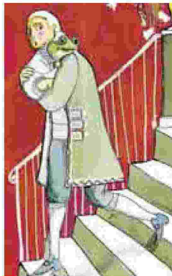
ILLUSTRAZIONI Qui sopra "Testa di rospo" e a destra "Tartarughino" da Capuana