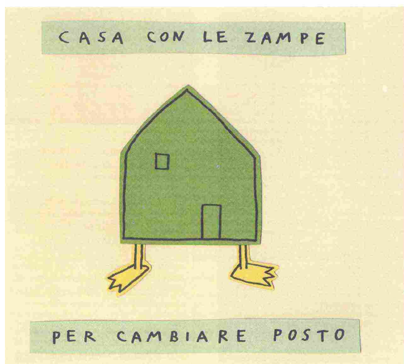
Illustrazione di Antonella Abbatiello per Case così (Donzelli)

Antonella Abbatiello, Case così , Roma, Donzelli, 2018, pp. 42, euro 13,50.