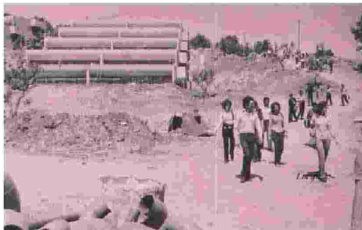
L'Unical nel 1972

«Affidare questo compito ad Andreatta fu una scelta intelligente. Seppe coniugare queste istanze con una visione pionieristica ma modernizzatrice, in senso forte e dirompente, condivisa dai meridionalisti calabresi come Mancini, Principe, Caldora, Gullo. volevano riscattare il meridione da una tradizione leguleia e parolai, da qui l'idea di un'università tecnico-scientifica, aperta anche alle discipline umanistiche, ma che nell'offerta tenesse fuori giurisprudenza. Un ateneo a numero chiuso, piccolo, in grado di coinvolgere totalmente gli studenti. L'Unical dei pionieri voleva plasmare il territorio e le nuove classi dirigenti. Una missione civilizzatrice, che suona quasi imperialista - lo so - ma non per questo fu meno entusiasmante. Il campus, sul modello statunitense in anni in cui Berkeley esercitava un forte fascino sull'immaginario, attirava studiosi da ogni parte. La lingua franca in quegli anni era l'inglese: ricordo le mie partite a bridge con una collega tedesca e una francese: non avremmo potuto intenderci in alcun modo,