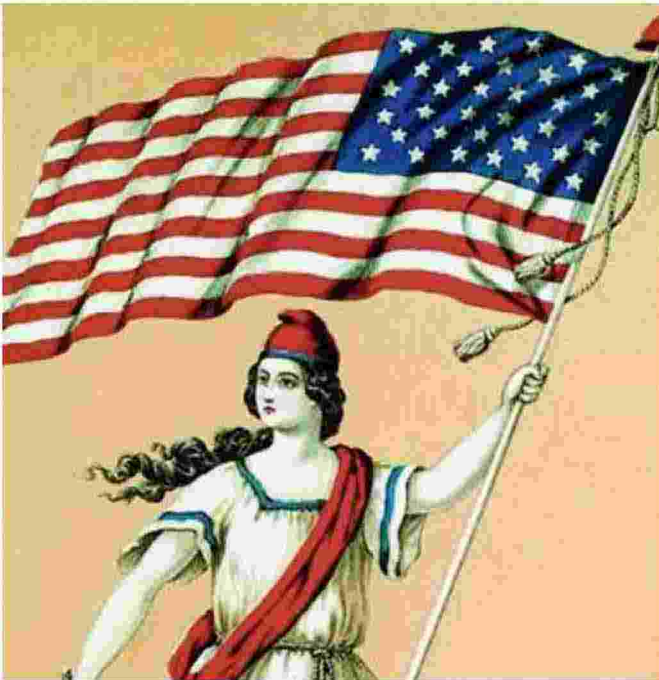
Immagine simbolo. Sulla copertina del saggio edito da Donzelli