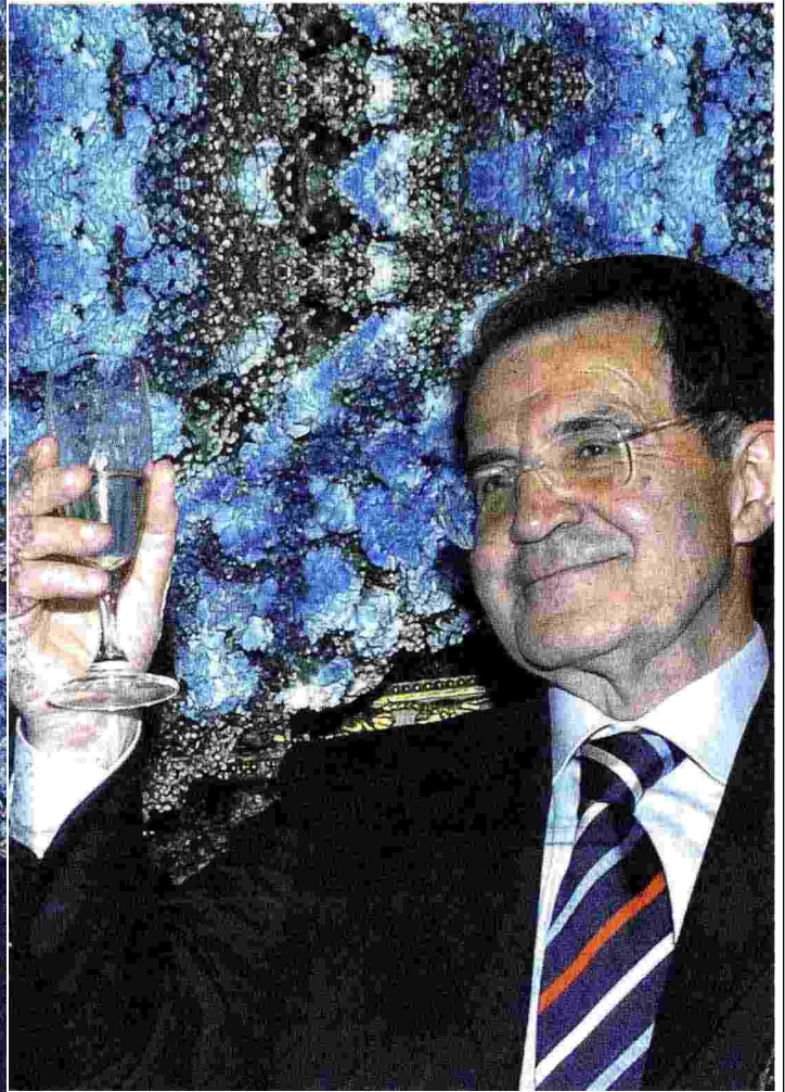
Silvio Berlusconi e Romano Prodi. Il primo confronto tv per le elezioni del 1996.