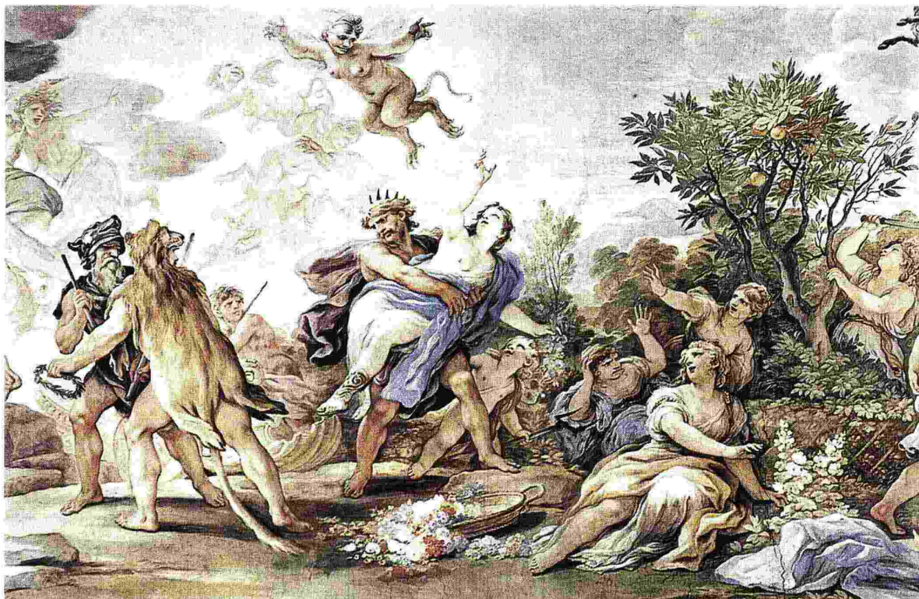
CLASSICITÀ Il «Ratto di Proserpina», quadro a tema mitologico del pittore napoletano del 1600, Luca Giordano