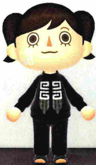
Fern, Avatar di Animal Crossing , esibisce un trucco (virtuale) di Givenchy . Sotto, uno scorcio del giardino incantato in cui sboccia Gucci Bloom in versione Arcade.