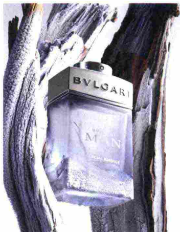
Le recenti creazioni di Alberto Morillas per Bulgari. A sinistra, la Glacial Essence Bulgari Man (edp, 60 ml, € 82); a destra, il solare Omnia Golden Citrine (edt, 40 ml, € 69).